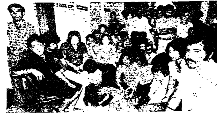
بعض المعتصمين في مكتب الأمم المتحدة (تصوير عبد الرحيم اللوز)

نظمت العائلات الروحية واليهودية الفلسطينية والشمالية صباح أمس، مسيرة هادئة انطلقت من أمام مركز التراث الفلسطيني الدائم في مبنى الامانة العامة لوكالة الأمم المتحدة في بيروت، ونفذ المشاركون فيها اعتصاماً يوم واحد احتجاجاً على عمليات الاعتقالات التي يشهدها العدو الصهيوني في صفوف عرب الأرض المحتلة، وبمطالبة بإطلاق سراح الأسرى والمعتقلين.